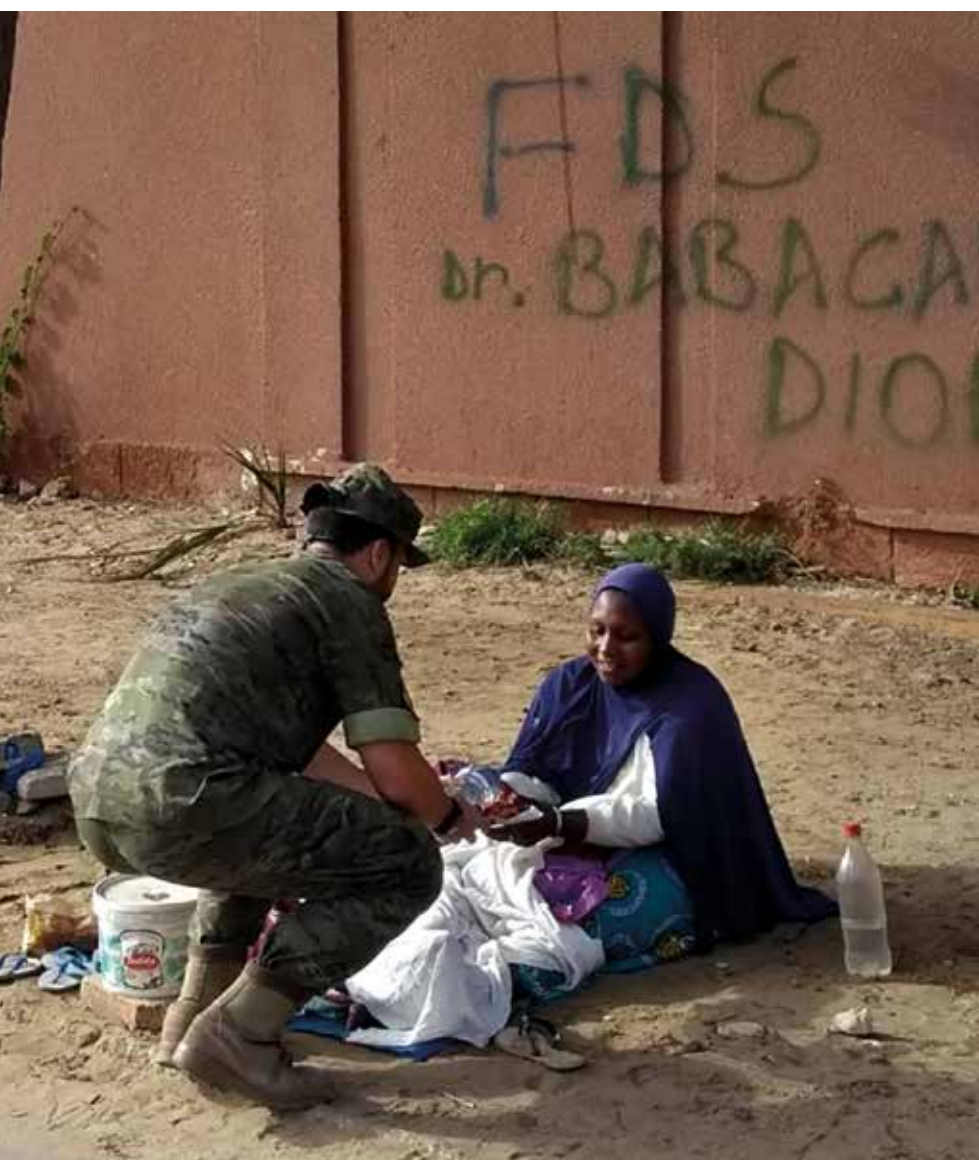
Labor humanitaria en el Sahel