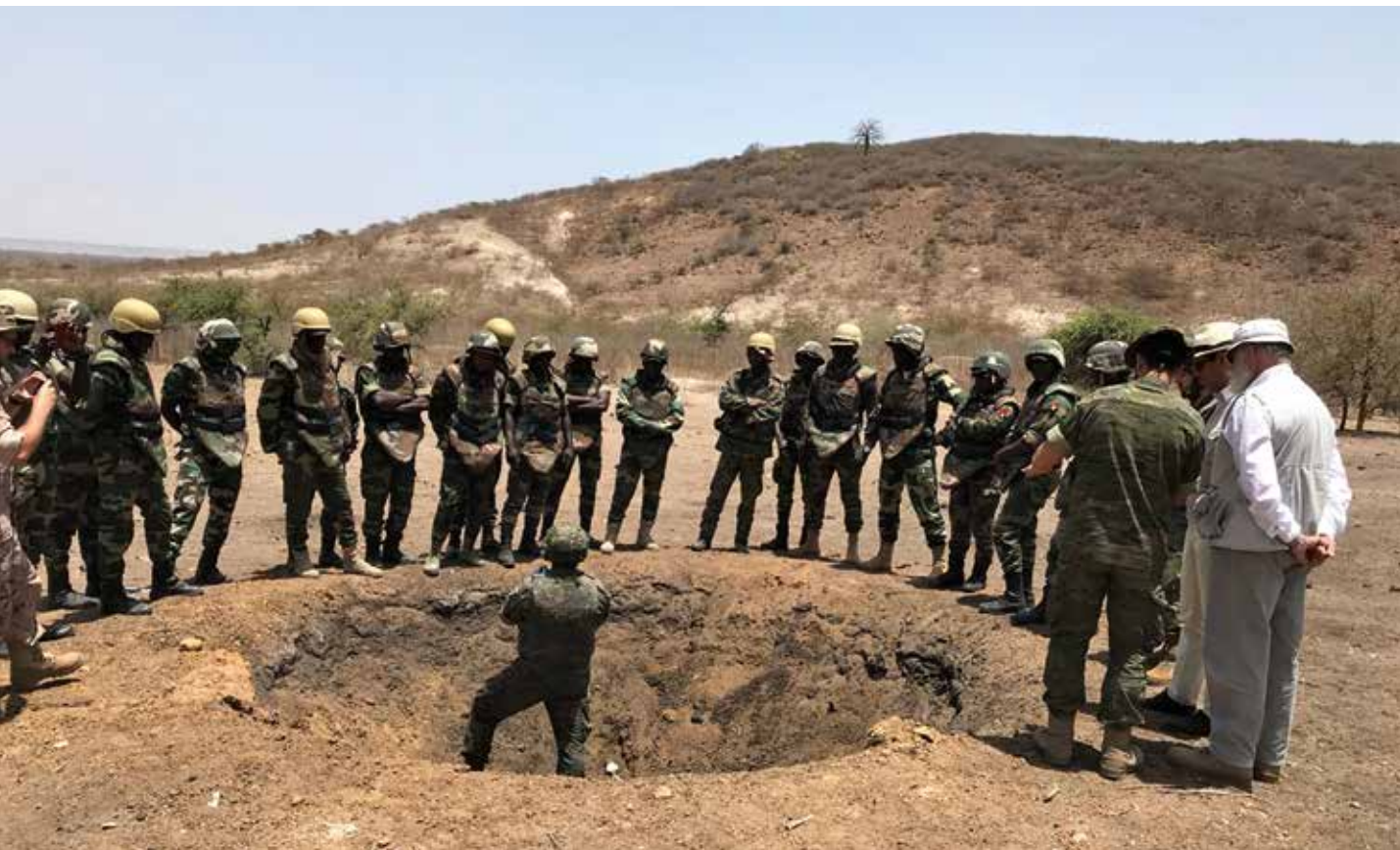
Misión de Seguridad Cooperativa en Senegal

combatientes y líderes, sigue contando con células terroristas por todo el país preparadas para atacar en cuanto se les ordene.