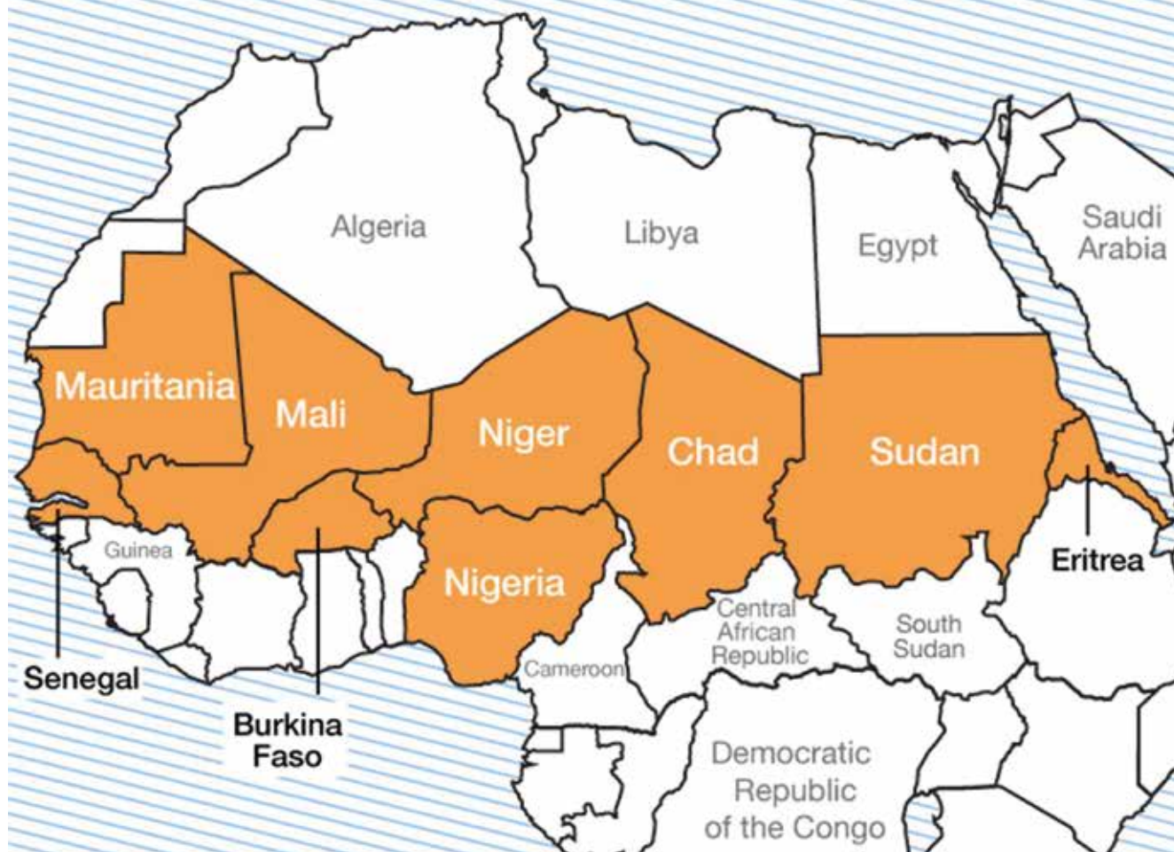
Mapa del Sahel

oportunidades, este sector de la población no tiene esperanzas económicas de futuro, por lo que son «objetivos asequibles» para ser captados por las redes terroristas.