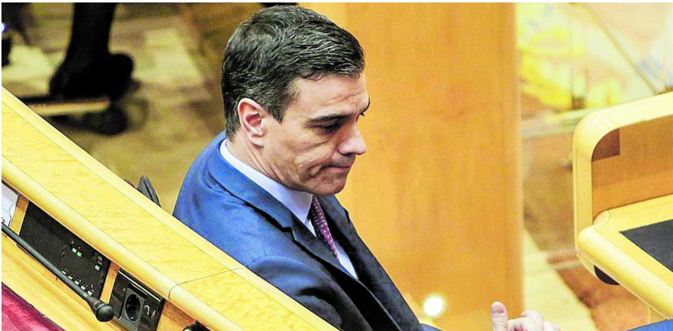
Pedro Sánchez: Una explicación inteligible

El actual secretario general del PSOE representa la última etapa de una historia que alcanza ya nada menos que 141 años, que abarca muchas luces y no pocas sombras. Pero a los efectos de las pretensiones de este artículo –que no son otras que explicar cómo el PSOE se ha convertido en lo que algunos han dado en llamar el partido sanchista– la historia comenzaría cuando Felipe González pierde ante Aznar las elecciones de 1996, y se da fin al período que ha permitido al partido gozar del mayor cúmulo de poder que haya tenido nunca en su historia, para culminar en el 35º Congreso del año 2000 y encumbrar a la Secretaría General a José Luis Rodríguez Zapatero. Porque para entender como ejerce hoy el poder Pedro Sánchez hay que analizar el que tuvo antes Zapatero. El uno no se puede explicar sin la existencia previa del otro. Vayamos por partes.